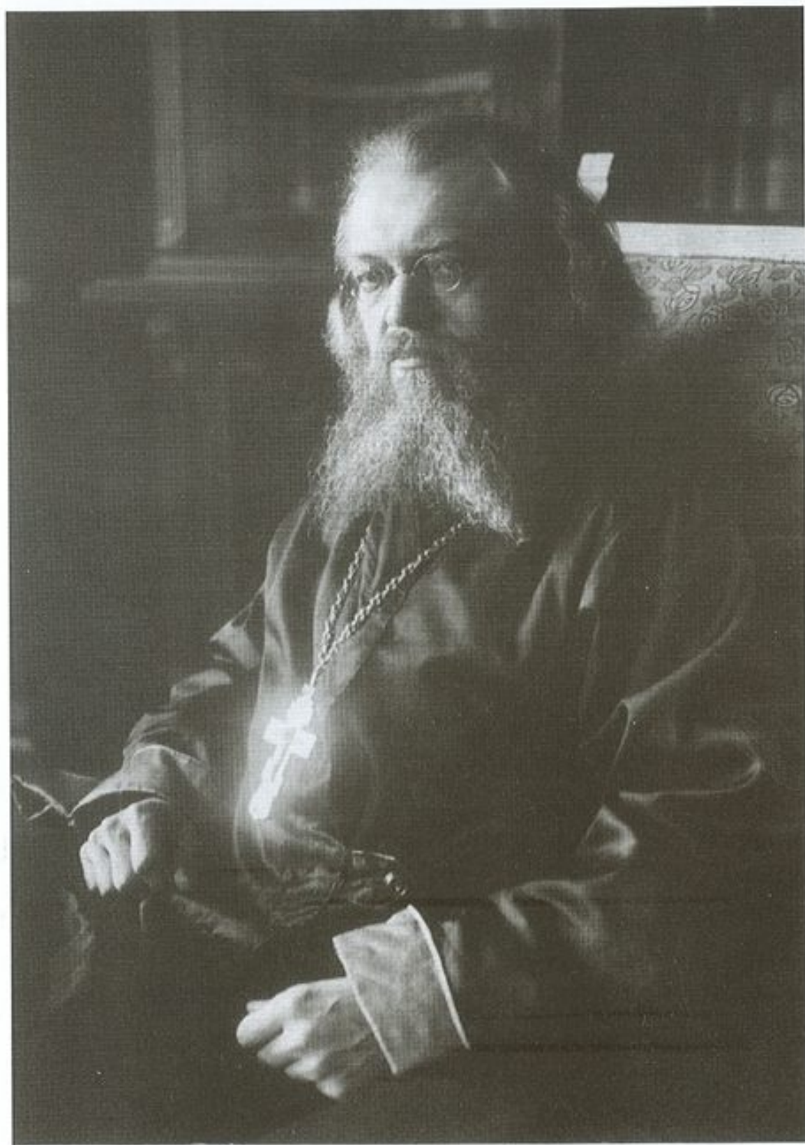
Τασκένδη 1921. Ο άγιος Λουκάς μετά τήν χειροτονία του