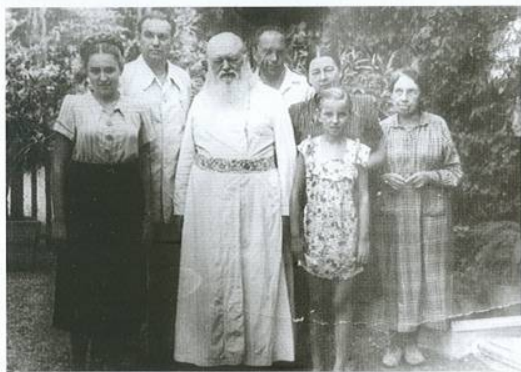
Άλούστα αρχές δεκαετίας '50.